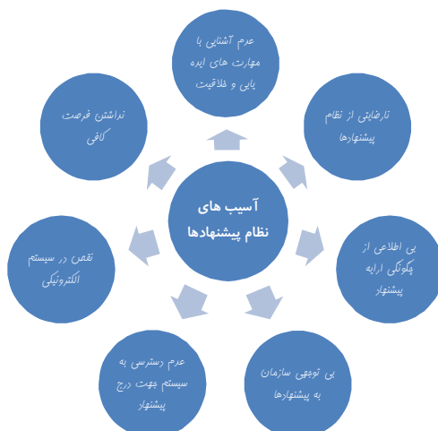
شکل یک: آسیب های موجود در سیستم نظام پیشنهادها [10]

درصد عمده ای از کارکنان در بسیاری از سازمان ها که نظام پیشنهادها را به کار گرفته اند در یک سال کاری، اصلاً پیشنهاد ارایه نمی دهند. آخرین بررسی ها نشان می دهد که در صد مشارکت کارکنان در نظام پیشنهادها در 150 شرکت متوسط ایرانی 20 درصد بوده است. در واقع 80 درصد کارکنان در فرآیند پیشنهاد وارد نشده اند. در شکل یک هفت دلیل عمده ارایه شده که مانع از طرح پیشنهاد توسط کارکنان در سازمان ها می شوند: